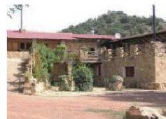
CASA LA SIERRA

ALOJAMIENTO: HABITACIONES PARA 4 PERSONAS 12€/HORA