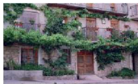
HOSTAL RURAL MARTÍNEZ

HABITACIONES 1 PERSONA..... 20€/ NOCHE 2 PERSONAS..... 35€/NOCHE 3 PERSONAS..... 45€/NOCHE 4 PERSONAS..... 52€/NOCHE